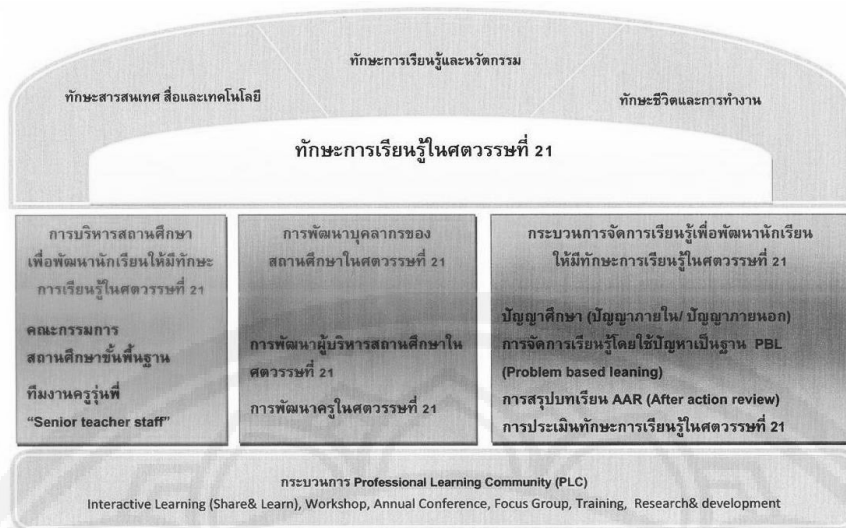
รูปที่ 1 รูปแบบการบริหารสถานศึกษาเพื่อพัฒนานักเรียนให้มีทักษะการเรียนรู้ในศตวรรษที่ 21 (Pre-Model)

ผู้วิจัยนำร่างรูปแบบการบริหารสถานศึกษาเพื่อพัฒนานักเรียนให้มีทักษะการเรียนรู้ในศตวรรษที่ 21 ให้ผู้เชี่ยวชาญจำนวน 23 คน ประเมินคุณภาพของรูปแบบ พบว่า 1) ด้านความเหมาะสมของโครงสร้างรูปแบบการบริหารสถานศึกษาเพื่อพัฒนานักเรียนให้มีทักษะการเรียนรู้ในศตวรรษที่ 21 พบว่า มีความเหมาะสมอยู่ในระดับมากที่สุด โดยผู้เชี่ยวชาญมีความคิดเห็นสอดคล้องกันทุกประเด็น 2) ผลการตรวจสอบคุณภาพของรูปแบบการบริหารสถานศึกษา ในประเด็นความเหมาะสม ธรรมชาติ ความเป็นไปได้ ความถูกต้อง