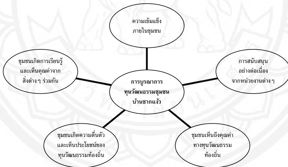
รูปที่ 2 ข้อสรุปเชิงทฤษฎีการบูรณาการทุนวัฒนธรรมชุมชนบ้านชากแง้ว